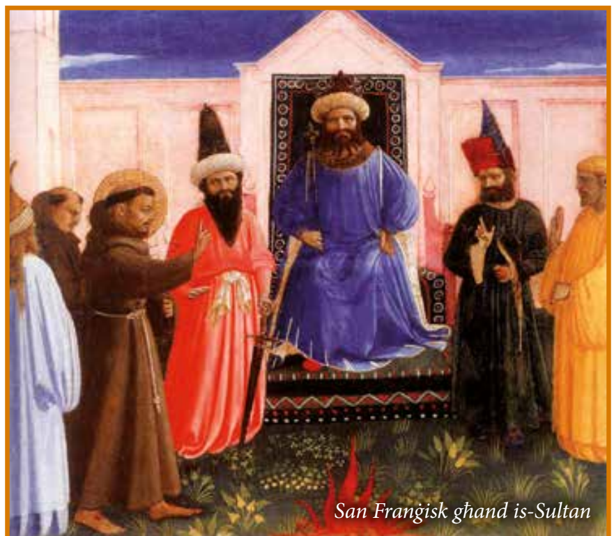
San Franġisk għand is-Sultan

Al-Kamil kien magħruf bħala mexxej Musulman qawwi imma pjuttost twajjeb. Kull meta kellu