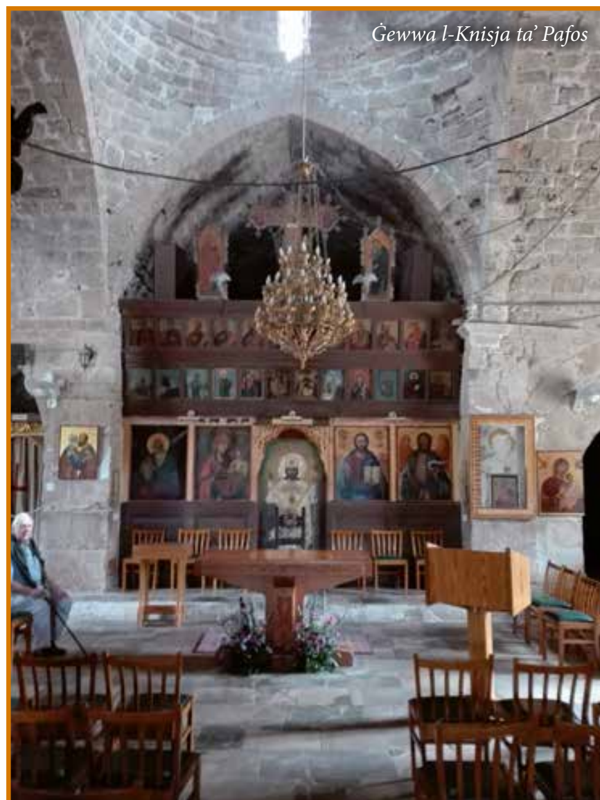
Gewwa l-Knisja ta' Pafos

Il-fatt li Barnaba kien ġej minn Ċipru qieghdu f'vantaġġ uniku biex imur jara b'għajnejh x'kien qieghed jiġri fil-Knisja ta' Antjokja. Għalkemm kien Lhudi, anzi kien levita, u naturalment kellu rabta speċjali mal-kult tat-tempju ta' Ġerusalem, u kien