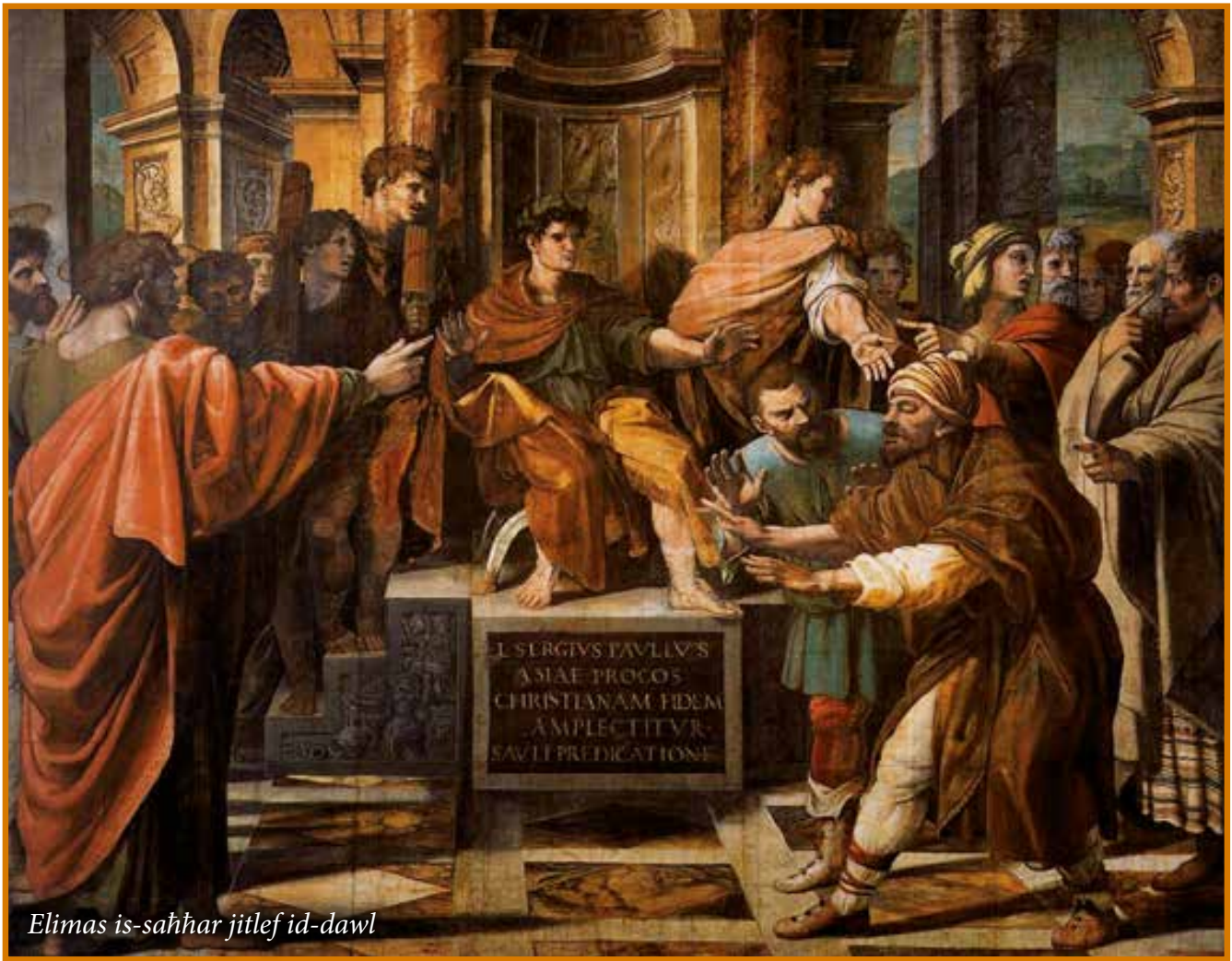
Elimas is-sahhar jitlef id-dawl

juża fil-vjaġġi missjunarji tiegħu. Kien l-ewwel idur fuq in-nies ta' ġensu u jippridkalthom lil Kristu. Meta dawn, kif kien jigrri ta' spiss, kienu jiċhdu l-messaġġ tal-Vanġelu, allura Pawlu kien idur ukoll fuq il-pagani u jippridkalthom. Ir-rakkont ta' Luqa ma għandux dettalji dwar il-waqfa taż-żewġ Appostli Barnaba u Sawlu f'Ċipru. L-Atti jgħidulna biss li "qasmu l-gżira kollha sa Pafos." Pafos hi l-port prinċipali fuq il-kosta tal-punent ta' Ċipru. Mela Barnaba u Sawlu qasmu Ċipru kollu. X'aktarx li għaddew tul il-kosta tan-nofsinar tal-gżira. Biex jaslu minn Salamina sa Pafos kellhom bilfors jgħaddu