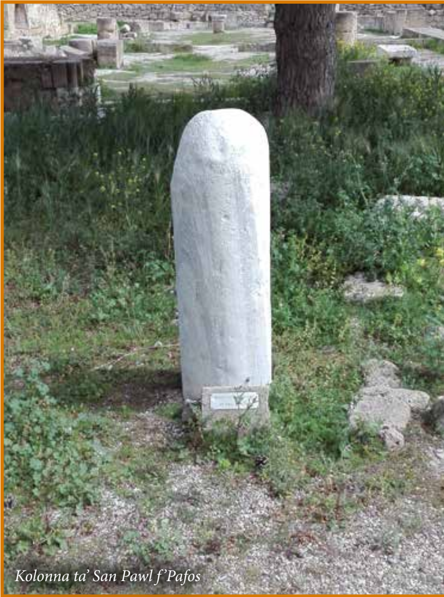
Kolonna ta' San Pawl f'Pafos

Minuri. Imma ma kellhiex tintemm f'dik l-okkazjoni. Nafu li, meta Pawlu stieden lil Barnaba biex imur miegħu għat-tieni vjaġġ missjunarju, dan ried jieħu miegħu lil Ġwanni Marku. Pawlu ma riedx, għax ma kienx aċċetta l-fatt li Marku kien abbandunahom waqt l-ewwel vjaġġ. Dan id-disgwid wassal biex Barnaba rritorna Ċipru darba għal dejjem u hemm temm il-ministeru apostoliku tiegħu. Dan il-fatt nafuh mill-istess Atti tal-Appostli 15,36-39: "Ftit taż-żmien wara, Pawlu qal lil Barnaba: