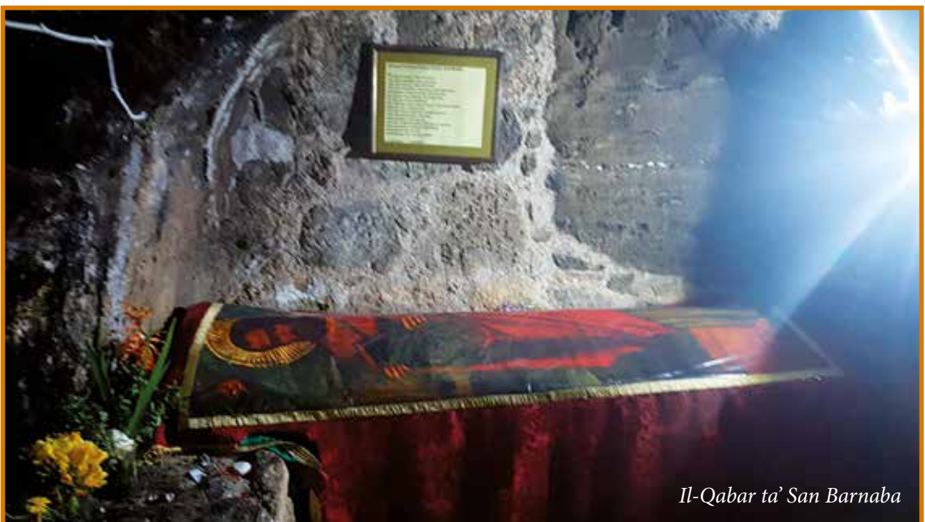
Il-Qabar ta' San Barnaba

Barnaba u Sawl, meta kienu Salamina, ippridkaw il-Vangelu fis-sinagogi tal-Lhud. Nafu li dan kien il-metodu li Pawlu kien