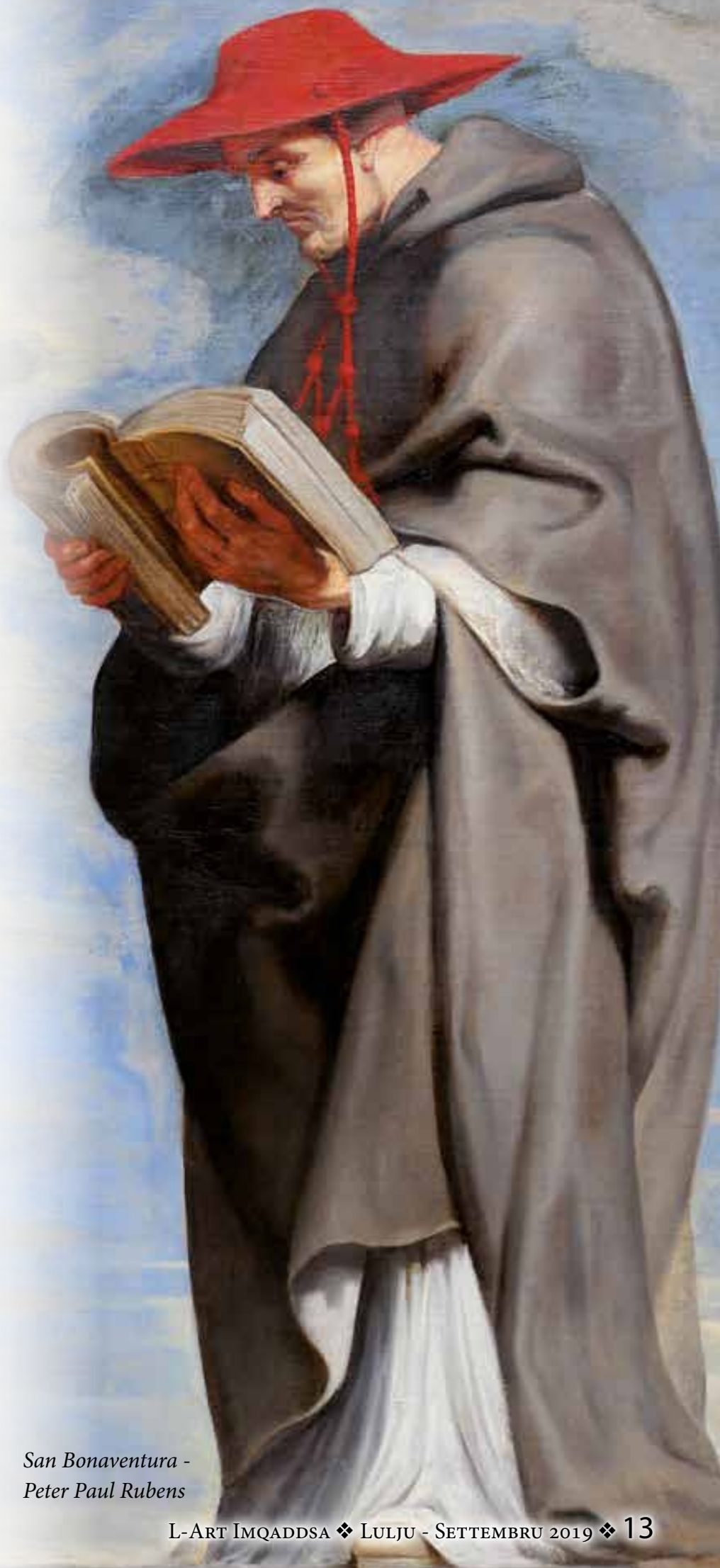
San Bonaventura - Peter Paul Rubens

“Il-missier l-aktar qaddis Franġisku, imqanqal mill-ħegga tal-fidi u tal-martirju, mar lil hinn mill-baħar ma' tnax minn shabu l-aktar qaddisin, u ried imur direttament għand is-Sultan. Malli wasal fl-artijiet tal-pagani, fejn it-toroq kienu mharsa minn irġiel kiefra li l-ebda Kristjan ma kien jista' jiltaqa' magħhom mingħajr ma jduq il-mewt, bir-rieda ta' Alla hu u shabu ħelsu mill-mewt. Qabduhom, sawtuhom b'diversi manjieri u rabtuhom sewwa, imbagħad haduhom quddiem is-Sultan. Quddiemu, San Franġisk, mghallem mill-Ispirtu s-Santu, ippriedka fuq il-fidi kattolika b'mod tant divin li offra lilu nnifsu