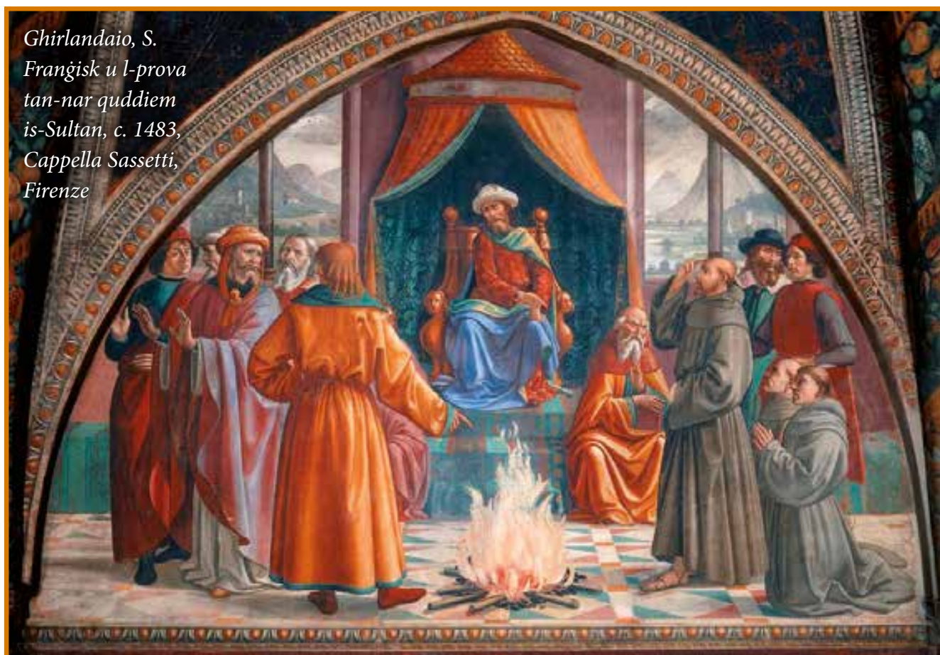
Ghirlandaio, S. Franġisk u l-prova tan-nar quddiem is-Sultan, c. 1483, Cappella Sassetti, Firenze

“L-imghallem ta' dawn l-aħwa, jiġifieri l-fundatur ta' dan l-Ordni, ġie fil-kamp tal-eżercitu tagħna, mimli bil-