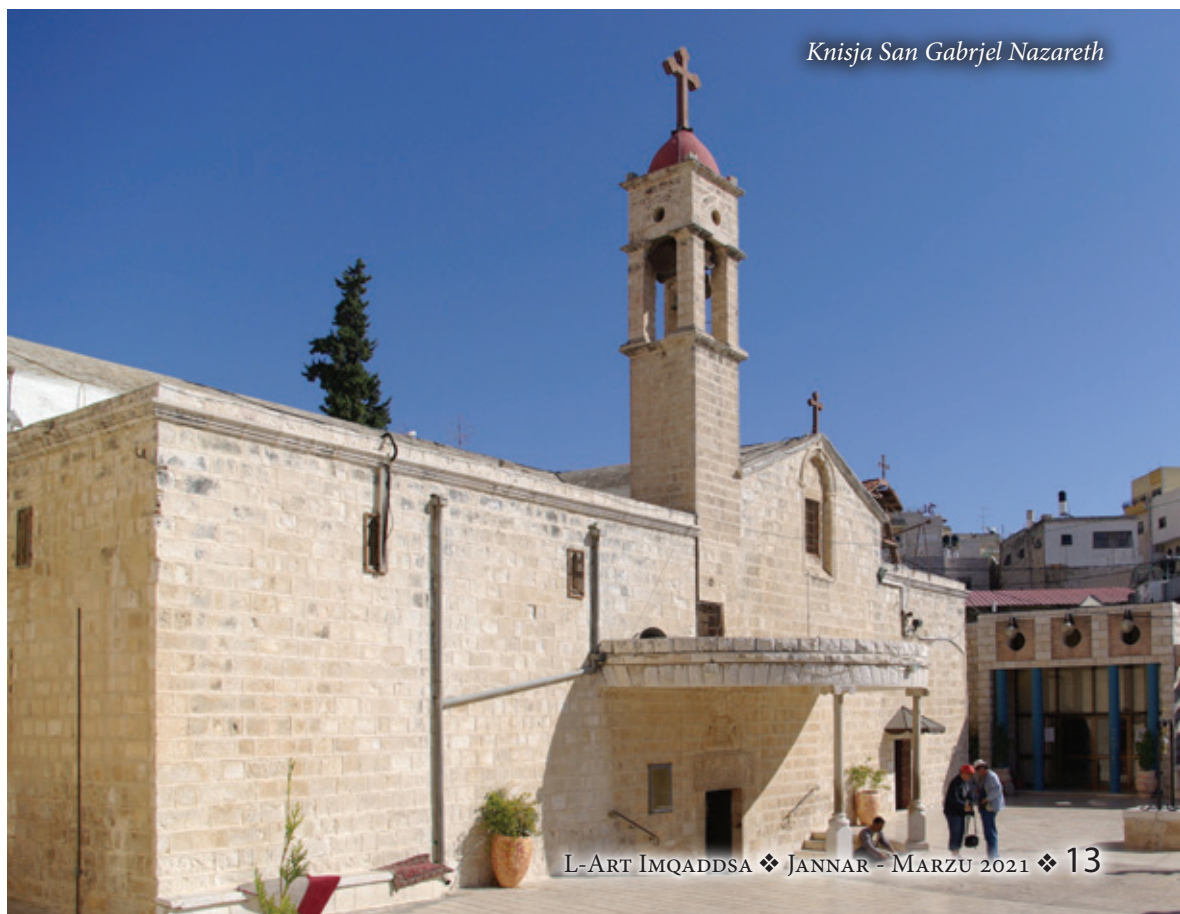
Knisja San Gabrijel Nazareth