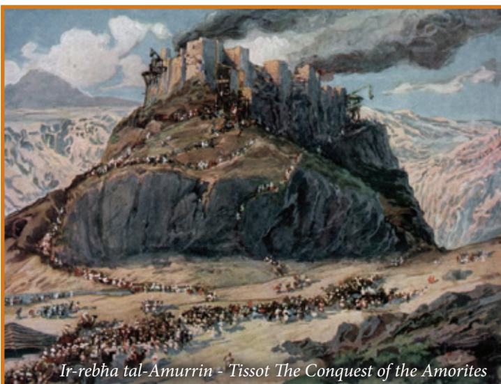
Ir-rebħa tal-Amurrin - Tissot The Conquest of the Amorites

Basan huwa d-distrett tat-tramuntana tat-Transġordanja, 'il fuq mix-xmara Ġarmuk. Hija żona fertili u fil-Bibbja jissemew 'il-barrin ta' Basan' (Għamos 4:1) biex jindikaw il-prospertà