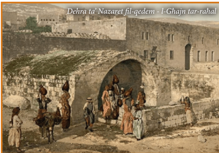
Dehra ta' Nazaret fil-qedem - l-Għajn tar-raħal

Il-kitba apokrifa magħrufa bhala Protovanġelu ta' Ġakbu , miktuba fit-2 seku fil-kuntest tal-komunità Lhudija-Kristjana fil-Palestina titkellem dwar Marija u t-tifikiriet tal-Annunċjazzjoni. Hi tqiegħed il-fatt f'żewġ postijiet distinti, fuq l-għajn u fid-dar, imma titkellem minn Ġerusalemm u qatt mill-Galilija, billi ssostni li Marija trabbiet u giet ikkonsagrata lil Alla fit-Tempju. Il-komunità Lhudija-Kristjana kellha interess teologiku aktar milli storiku. Bl-iżvilupp tal-komunità Ġentili-Kristjana (jiġifieri l-komunità ta' Kristjani li kienu kkonvertew mill-paganeżmu) iż-żewġ fatti jiġu murija l-ewwel fl-għajn tar-raħal (fejn illum hemm il-knisja Griega-Ortodossa ta' San Gabrijel) u fid-dar tal-Vergni Marija, l-għar-knisja tal-Annunċjazzjoni.