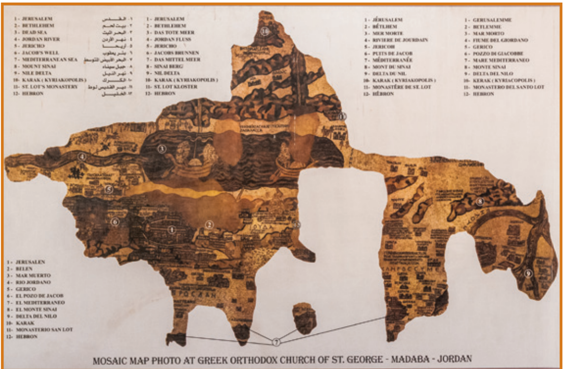
MOSAIC MAP PHOTO AT GREEK ORTHODOX CHURCH OF ST. GEORGE - MADABA - JORDAN

Id-deskrizzjonijiet storiko-ġeografici: għandna żewġ eżempji ċari. Il-lista tan-nazzjonijiet li nsibu f'Ġenesi 10, lista li tagħtina deskrizzjoni etnoġeografika tan-nazzjonijiet li magħhom Israel kellu xi relazzjoni u li ssawret biex turi li dawn kollha kienu ġejjin minn missier wiehed. Għandna speċi ta' arblu tar-razza patrijarkali li jmur lura għall-perijodu storiku tas-Saltna magħquda. F'Ġożwe 12 insbu wkoll lista tal-ibliet rjali ta' Kangħan li jissemmew fir-rakkont ta' l-insedjament tal-poplu fl-art imwiegħda. Interessanti hija l-lista tal-bqija tal-art li ma ġietx mirbuħa (Ġożwe