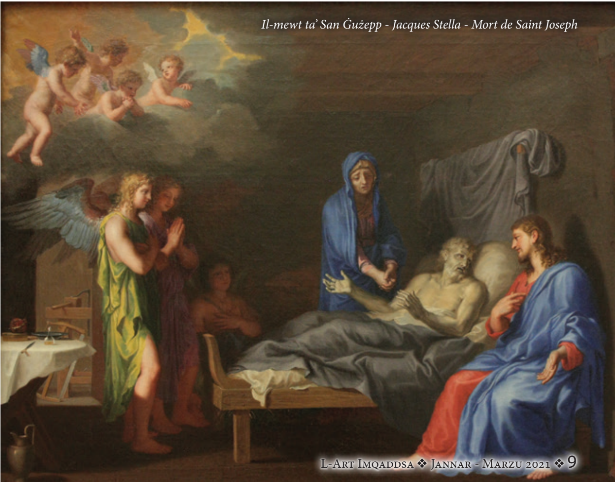
Il-mewt ta' San Ġużepp - Jacques Stella - Mort de Saint Joseph

Kien Eġesippu li tana r-rakkont li wasal għandna