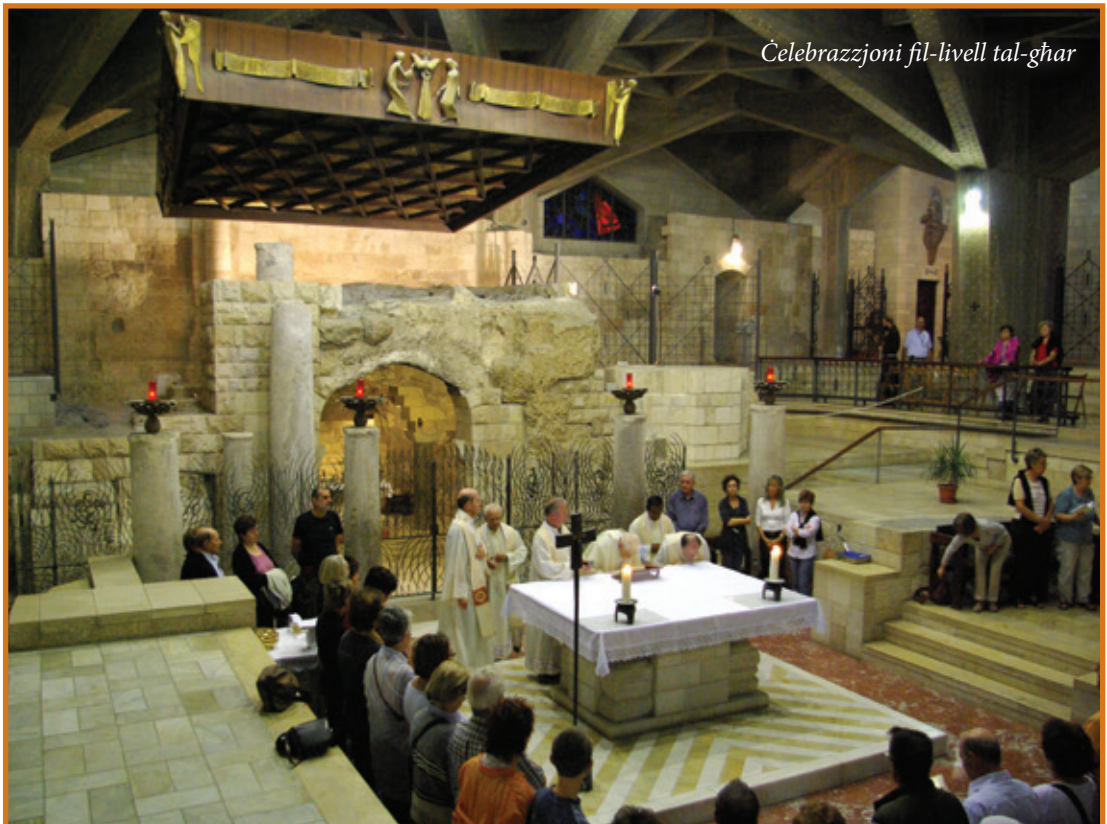
Celebrazzjoni fil-livell tal-għar

San Luqa joffrilna deskrizzjoni topografika tar-raħal meta jikteb: "Meta semgħu dan fis-sinagoga kulhadd imtela bil-korla; qamu, u ħarġuh 'il barra mill-belt, ħaduh fuq xifer