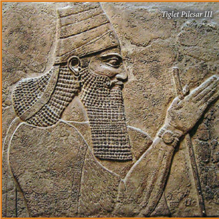
Tiglet Pilesar III

jmorru lura għall-ewwel nofs tas-seklu XIV QK.