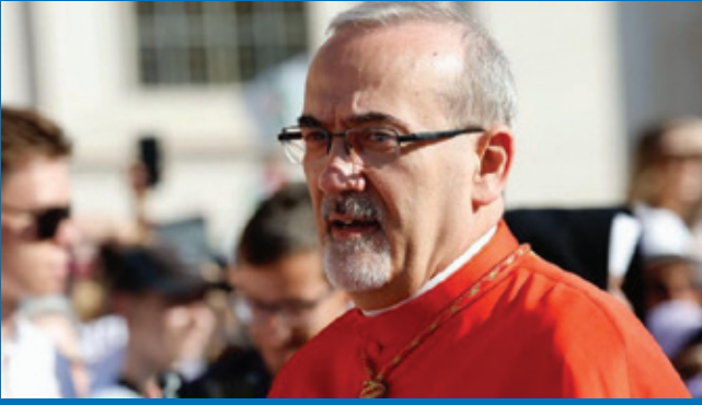
Kardinal Pierbattista Pizzaballa

li timponi waqfien mill-ġlied, minhabba l-interessi politiċi u ekonomiċi ta' pajjiżi li, kieku jridu, jistgħu jġibu differenza, imma li jippreferu jilagħbuha ta' spettaturi passivi jew jagħtu immaġini mhix vera tal-veri intenzjonijiet tagħhom taħt l-umbrella tad-diplomazija.